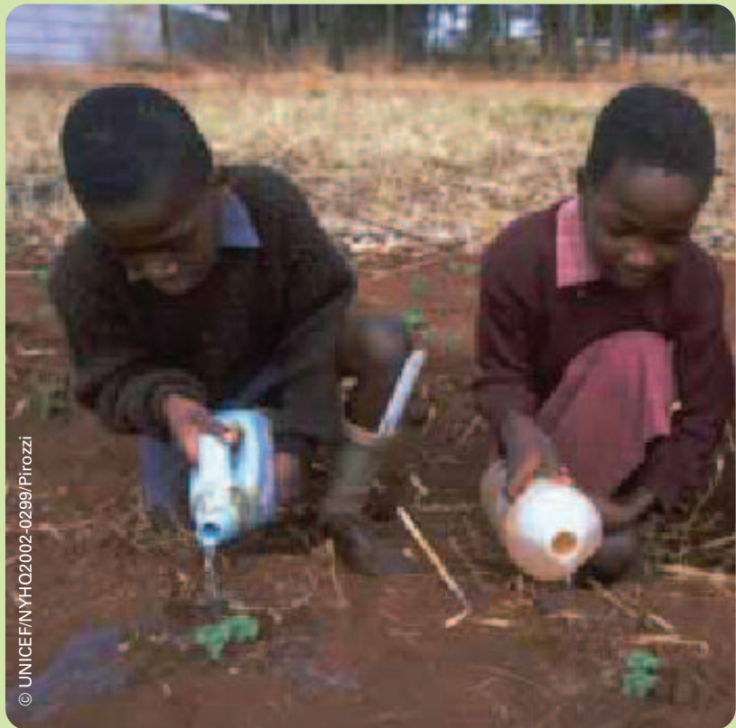
Au Niger, des jardins communautaires sont synonymes d'espoir.

La nature est un équilibre, mais les êtres humains influent sur les rythmes naturels de la planète; nous modifions le cycle mondial naturel de carbone en brûlant de manière excessive les combustibles fossiles. Les forêts, les sols, les océans, l'atmosphère et les combustibles fossiles constituent d'importantes réserves de carbone, lequel passe constamment de l'un à l'autre de ces différents réservoirs qui agissent comme des « puits » ou des « sources ». Un puits absorbe plus de carbone qu'il n'en libère, tandis qu'une source émet plus de carbone qu'elle n'en absorbe. Avant la révolution industrielle, la quantité de carbone qui transitait entre les arbres, le sol, les océans et l'atmosphère était relativement équilibrée. En utilisant du pétrole, du charbon et du gaz, nous créons beaucoup plus de sources que de puits, ce qui modifie l'équilibre naturel.