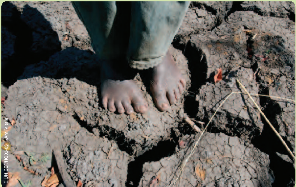
Un garçon se tient pieds nus sur le sol desséché et craquelé dans le sud du Malawi. En 2005, la sécheresse a entraîné une importante pénurie alimentaire qui a laissé quatre millions de personnes sans ravitaillement adéquat en vivres.