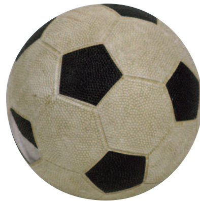
Jouer et avoir des loisirs