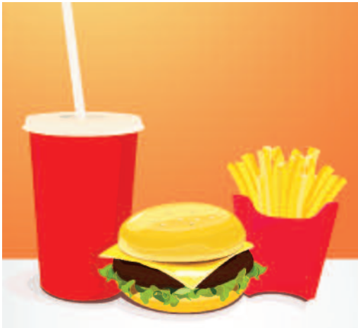
Des hamburgers et des frites