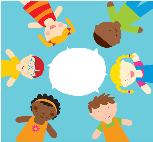
La possibilité d'exprimer tes idées