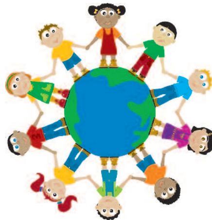
Un traitement équitable et la protection contre la discrimination