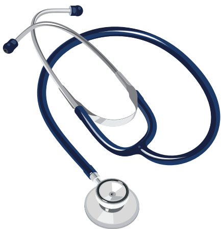
Des soins de santé

* Certains éléments classés comme des « désirs » peuvent être des besoins dans certaines circonstances. Par exemple, il peut être important d'avoir accès à un téléviseur ou à un ordinateur pour recueillir ou partager de l'information dans le but de garantir le droit de se développer sainement et d'être protégé contre la violence et les mauvais traitements.