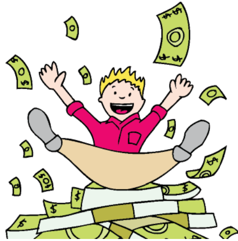
De l'argent à dépenser