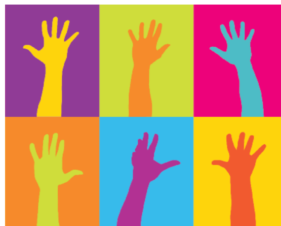
La possibilité d'avoir ta propre culture, de parler ta langue et de pratiquer ta religion