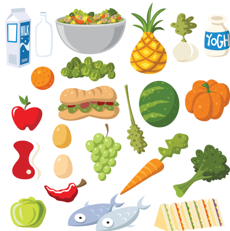
Des aliments nutritifs