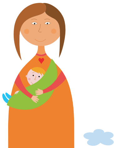
La protection contre les mauvais traitements et la négligence