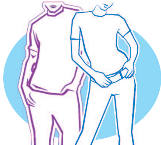
Des vêtements à la mode