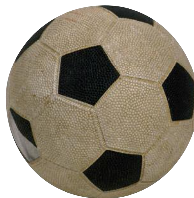
Jouer et avoir des loisirs