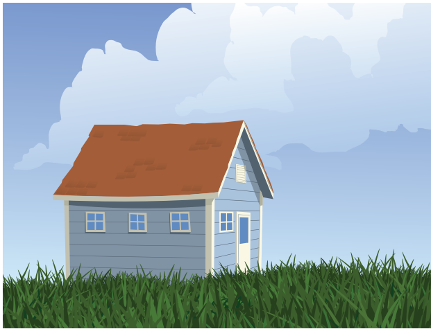
Un logement convenable