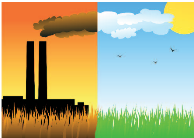
De l'air pur